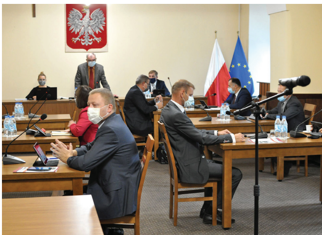
Zgromadzeni na sesji radni