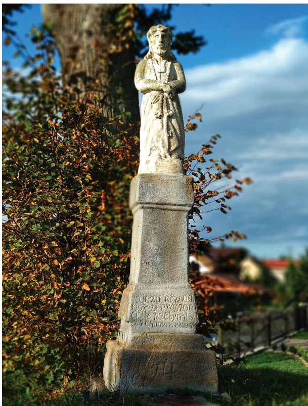
Figura Chrystusa w Kaniowie

W ramach Gminnego Programu Opieki nad Zabytkami, wzorem lat ubiegłych, gmina Bestwina zleciła wykonanie gruntownych prac restauracyjnych i konserwatorskich kapliczki przydrożnej „Figura Chrystusa na postumencie” z 1814 roku, usytuowanej u zbiegu ulic Stefana Kóska i Walentego Furczyka w Kaniowie. W ramach zadania wykonana zostanie dokumentacja stanu zachowania, usunięcie wstawk, zacierek, łat cementowych, doczyszczanie powierzchni kamienia z wtórnych nawarstwień, fałszywej patyny i przemalowań, przeprowadzenie zabiegu odsolenia piaskowca, całościowa impregnacja wzmacniająca kamień preparatem krzemooorganicznym, sklejenie pękniętych elementów, rekonstrukcja form architektonicznych i rzeźbiarskich, scalenie kolorystyczne jego powierzchni, wzmocnienie struktury, poprzez wykonanie zabiegu końcowej impregnacji oraz hydrofobizacji, jak również sporządzenie dokumentacji opisowej i fotograficznej.