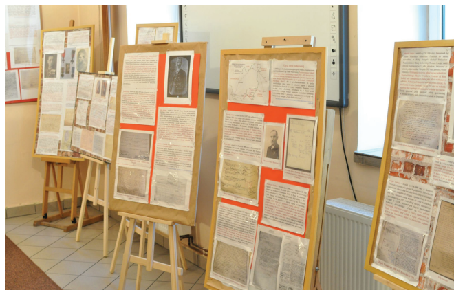
Fragment wystawy o losach naszych rodaków

Ekspozycja pt. „ Tu byli nasi – walka o granice II Rzeczypospolitej ” jest efektem współpracy Muzeum i Towarzystwa Miłośników Ziemi Bestwińskiej. Opiera się w całości na materiałach źródłowych – pozyskanych lokalnie lub z archiwów, szczególnie zaś z Centralnego Archiwum Wojskowego w War-