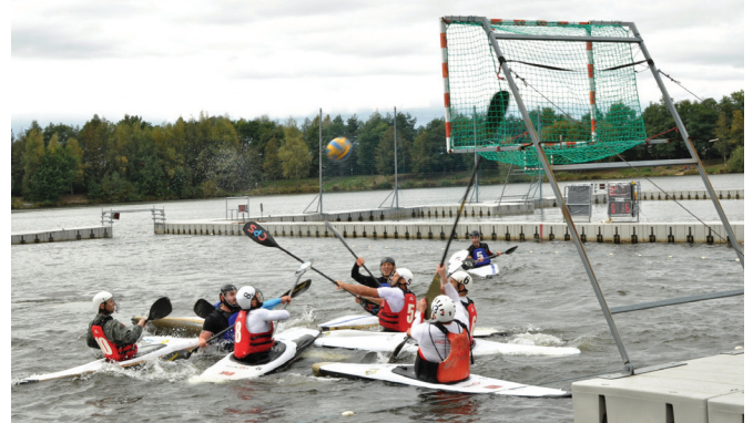
Mecz finałowy I Dywizji