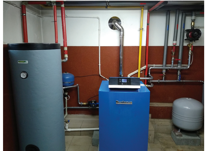
Instalacja grzewcza w GOK

Warto zaznaczyć, że fundusze na wspomniane przedsięwzięcie pochodzą ze środków, które zaplanowane były w budżecie na 2020 rok na bieżącą działalność Ośrodka, głównie imprezy plenerowe. Decyzją Wójta Gminy Bestwina oraz Rady Gminy, zważywszy na sytuację epidemiologiczną kraju, część z nich przeznaczono na wspomnianą modernizację. Obiekt gruntowny remont przechodził w latach 2004–2006, a w ostatnim czasie jego stan uległ pogorszeniu (przeciekający dach, notoryczne problemy z centralnym ogrzewaniem), a biorąc pod uwagę funkcję jaką pełni oraz ilość osób korzystających z oferty kulturalnej wymagał tego typu decyzji.