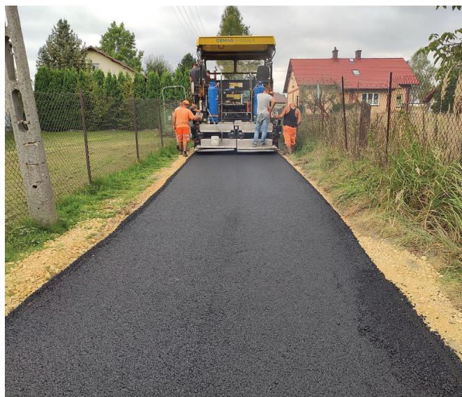
Asfaltowanie ul. Świerkowej