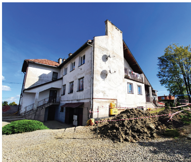
Przedszkole w Janowicach